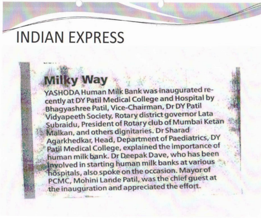
Indian Express 11/09/2013